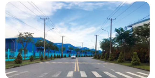
交通系统 • 主路的宽度：20m • 内部道路：8m