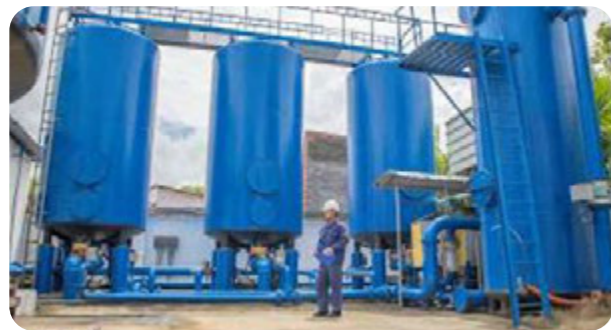
供水系统 使用芹湫县供水厂的供水