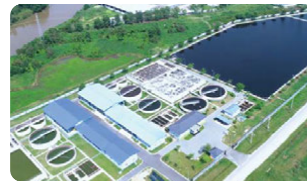
纺织染整行业污水处理系统