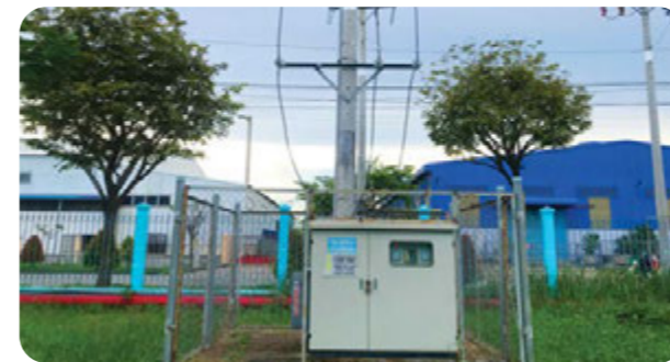
供电系统 • 内部站：110kV/22kV • 总功率：5,610kVA