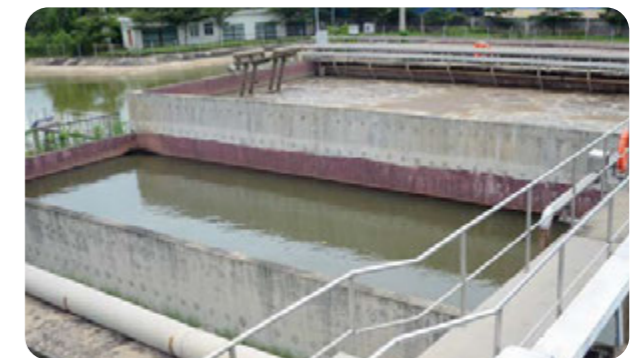
普通行业污水处理系统