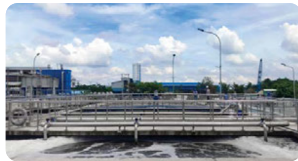
污水处理系统 • 功率设计：1,100m 3 /昼夜 • 现在设计：1,100m 3 /昼夜